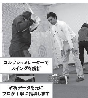
ゴルフシュミレーターでスイングを解析 解析データを元にプロが丁寧に指導します

導入機器は最大手「GOLFZON」の最新機器。スイングをデータで解析し、ティーチングのプロがスイングの悩み原因を特定し、解決します。