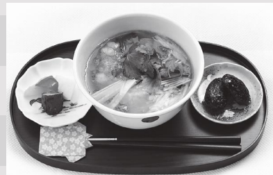
信州らしく小布施の栗を使った「かわり雑煮」（850 円）。要事前問い合わせ。

舞っていた。軽井沢での再オープン をきっかけに、新たにメニューに追加。「おおぶりのお餅が 2 つ入っているの、お昼ご飯にも十分なボリューム。定番のオリジナルブレンドコーヒーにも合いますよ」。