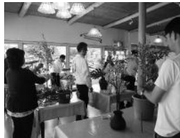
30分で作品を制作する。