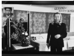
假屋崎さんが一つずつ作品を見て才能の有無やアドバイスを述べた。