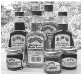
大(250ml)1,715円、中(125ml)1,000円、ミニ(25ml)343円(税別)