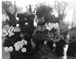
バラやダリア、トルコキキョウなど豊富な種類から花を選ぶ。