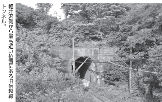
軽井沢側から最も近い位置にある旧信越線トンネル。

北朝鮮のミサイル想定、避難場所に確氷トンネル 高額防護服購入は見送り 軽井沢町は、北朝鮮のミサイル発射などを想定し、有毒ガスに備えた防護服や防毒マスクなど30セット（費用160万円）の購入を検討していたが、町議会6月会議に補正予算案を提出しなかった。町民から「軽井沢町だけ特別に危ないのか」など否定的な意見があり、予算を査定していく過程で「総合的に判断した」という。