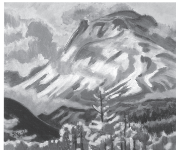
紅浅間 1968 年作