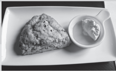
花豆のスコーン 400 円（税別）紅茶 550 円（税別）

花豆を使ったパイやタルトは見かけが、スコーンというのは珍しい。豆から煮て甘さや硬さを調節し、大6個を刻んでまぜるという贅沢な作り。スコーンに付けるクリームは、クロテッドとサワークリームの中間の濃さにして、花豆の味を活かすよう工夫しているという。好みにかけるシロップには、低GI食品のアガベシロップを使用。スコーンに添える紅茶も、ここのオリジナル。4種類の中からこの日はカルーゼルという紅茶を選んだ。リンゴと