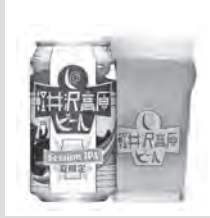
350ml 315円(税抜) TEL 0267-66-1211 (ヤッホーブルーイング)

軽井沢産小麦「ゆめかおり」を一部使用した夏限定のビール。爽やかに鼻を抜けるトロピカルフルーツのようなホップアロマと、軽い飲み口が特徴。パッケージはハンモックに揺られる「ツキノワグマ」が、別荘で夏を過ごす場面を表現している。