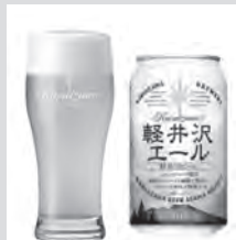
350ml 288円(税込) TEL 0120-919-144 (軽井沢ブルワリー)

ゴールドの光沢と、軽井沢の冷涼名水で仕上げた奥深いフルーティな風味とクリーミーな泡立ちが特徴。冷蔵庫から出してすぐの4℃では爽快感と喉ごし、冷蔵庫から出して15分程の10℃ではフルーティな香りと、2度味を楽しめる。