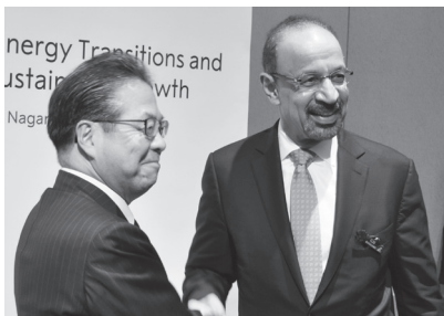
握手を交わす世耕弘成経済産業相とサウジアラビアのアルファレーフ大臣。胸には軽井沢彫のバッジが見える。

町からの記念品 軽井沢彫バッジつけ会台へ 会合期間中、閣僚らは軽井沢彫のバッジを胸につけて会合に臨んだ。これは、町が大坂屋家具店に制作を依頼し、記念品として贈ったもの。軽井沢彫のモチーフに使われる桜と浅間山、公式ロゴを彫り込んでいる。同