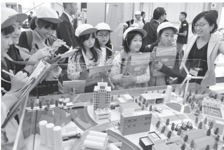
水素エネルギー社会を表した環境省制作のジオラマの前に、説明を受ける中部小の児童。

地元小学生も感動 最先端の技術、間近に 水素エネルギーや海洋プラスチックごみに関連した最先端の技術を紹介する「G20イノベーション展」が6月14日から16日、軽井沢プリンスショッピングプラザ駐車場で開かれた。トヨタ自動車やサントリーホールディングスなど、約90の企業や団体が出展。月面の有人探査モビリティの小型模型などを展示。微生物の力で二酸化炭素と水に分解されるプラスチックなども紹介した。14日、G20参加国など