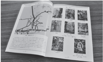
A4 版カラー、69 ページ。1100 円。歴史民俗資料館、追分宿郷土館、軽井沢町植物園などで販売。

軽井沢町教育委員会は 9 月、町内各地区の代表的な石像物を紹介する「軽井沢町石像物ガイドブック」を制作した。1 年半かけて 850 体以上の所在調査を行い、その中から代表的な 247 体を紹介している。前半で、過去の軽井沢での暮らしの一端がわかる石像物を取り上げ、建立の由来などを記述。後半はエリアごとに石像のある位置を地図で示し、名前や建立年、写真を掲載した。「ガイド