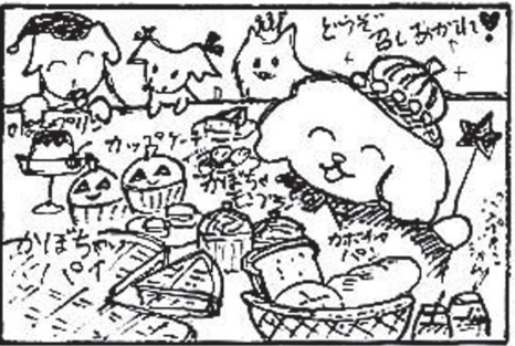
マリンのブログも見てね。「マリン記者」で検索。