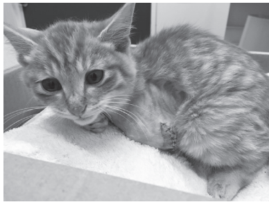
左前脚を切断し、手術跡が残る猫。原院長によると、3本脚でも歩けるようになるという。

狩猟目的のトラバサミの使用は、1年以下の懲役か100万円以下の罰金に処せられる可能性がある。原院長は「有害鳥獣であっても、トラバサミにかかって半日とか、1～2日の間苦しむのだとしたら非情な拷問だと思う」と話している。