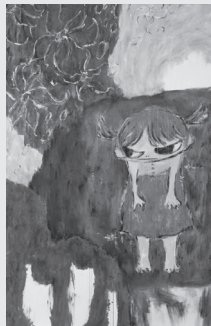
「無題」2006年 ロッカクアヤコ

ロッカクアヤコ-COLORFUL WORLD- 11/24(日)まで、軽井沢現代美術館／ 現代美術家ロッカクアヤコさんの絵画・ 立体・映像・資料など計15点を展示。 入館料大人1000円。TEL0267-31-5141