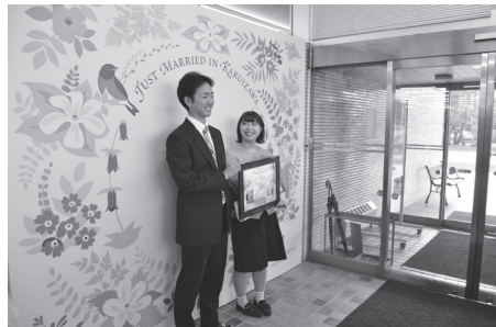
軽井沢のオリジナル婚姻届を手に、パネル前でモデル役を務める役場職員。

軽井沢町役場庁舎の南玄関入口と宿直室前の2カ所に、婚姻届を提出したカップルの記念撮影用フォトブースパネルが設置された。ウェディングの街をPRしようと、11月22日の「いい夫婦の日」に合わせ、軽井沢ウェディング協会が制作し町へ寄贈。2カ所とも同様のデザインで、アカハライロ、コブシなど、軽井沢ゆかりの動植物が中央の2人を囲むように配した。撮影者がいないときは「カメラマンになりますので、近くの職員にお声かけください」