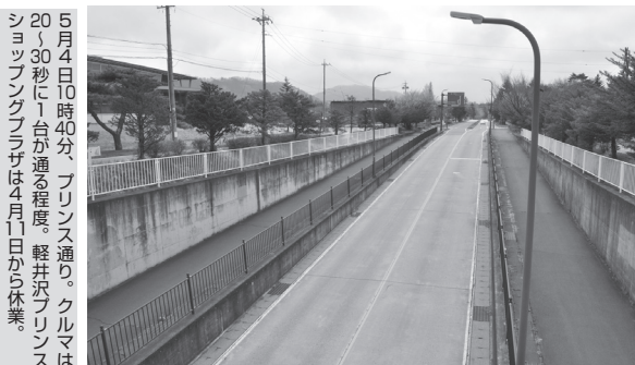
5月4日10時40分、プリンス通り。クルマは20~30秒に1台が通る程度。軽井沢プリンスショッピングプラザは4月11日から休業。

「焼け石に水。いつものGWに比べたら売り上げは微々たるもの」と窮状を訴えた。バス運行などの草軽交通は4月30日、旧軽井沢ロータリーで40年以上営業を続けてきた売店を閉めた。会社の事業計画を考えていくなかで、「観光客が