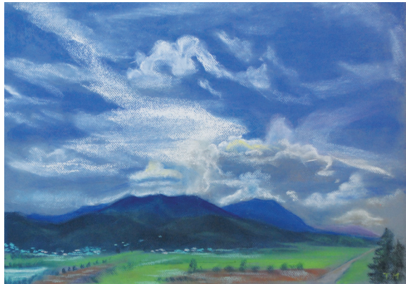
東京から軽井沢に向かう途中の光景です。雲の様があまりにも面白かったので画にしてみました。

丸山輝 (まるやまてる) 学習院大学卒業。N.Y.在住作家ジョージ・ピーター氏に油絵を師事。2003年から2、3年おきに旧軽ギャラリーで色でパステル画個展を開催。