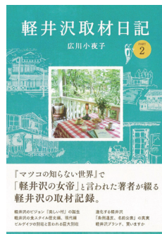
爽風社刊 1500円(税別) 町内書店、アマゾンで販売

軽井沢新聞前編集長の広川小夜子さんが、昭和後期から平成初期を描いた『軽井沢取材日記』の続編として『軽井沢取材日記 PART 2』を発表した。2020年春までの約20年の取材をもとに、「ビル・ゲイツの別荘と言われる巨大別荘」や「進化