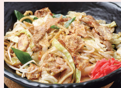
カリカリのイカ天、野菜と肉がたっぷり入った焼きそば(スープ付き、800円)。

旧軽井沢・聖パウロ教会の通り沿いに、夏季限定の焼きそば専門店がオープン。本場関西から仕入れる弾力のある太麺と、フルーティーな甘さのオリジナルソースを使ったメニューは10種類以上。ベーコンと魚介をニンニクの効いたオリーブオイルで炒めるペペロンチーノ風の焼きそばもある。「カレーなど日によって変わる一品に焼きそばとスープ、漬物が付くコンビプレート(1,200円)はランチのオススメです」と店主。夕方からはおつまみメニューもあるのでお酒と一緒に楽しめる。