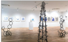
青木野枝展示風景