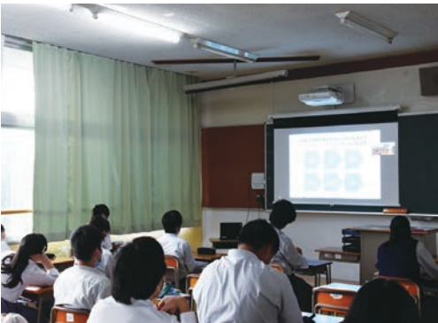
9月3日の初回授業では、課題発見、解決のためのガイダンスが動画配信で行われた。

また、10月に3日間就業体験へ向き、地元企業の問題を発見・解決策を提案するプログラムも実施。就業先へ発表するためのプレゼン資料作りな